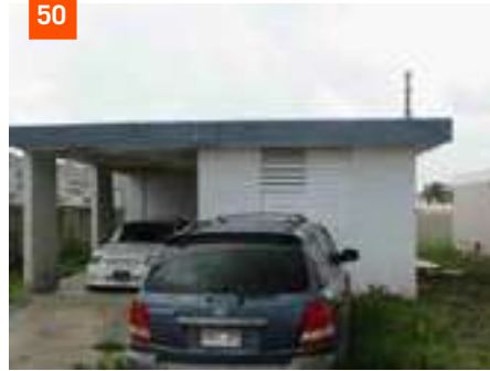
50 Naguabo Urb. Brisas del Valle, G-7, Calle 8 CATASTRO: 256-021-307-35-000 Casa 3H / 1B 276 M/C 783 P/C 18.20986 -65.74401