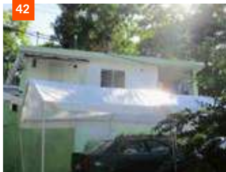
42 Caguas C. Las Carolinas, #262 Calle Orquídea CATASTRO: 198-090-016-69-001 Casa 3H / 1B 533 M/C 761 P/C 18.252108, -66.067756