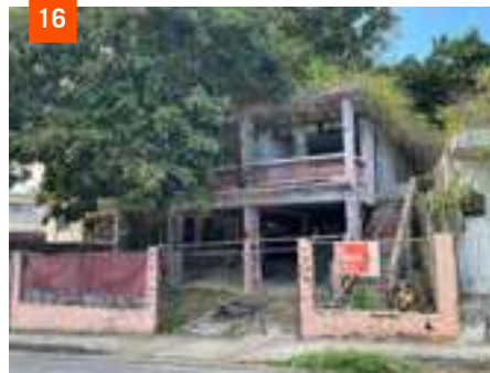
16 Fajardo Casa 2H / 1B Bo. Quebrada, 670 C/ Stgo. Iglesia Pantín CATASTRO: 150-085-146-14-000 18.31686067, -65.66116551