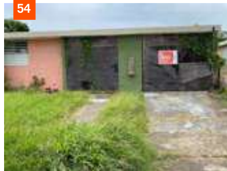
54 Naguabo Urb. Extensión Ramón (Diplo)-L-12 Calle 14 CATASTRO: 256-033-095-21-001 Casa 3H / 2B 514 M/C 919 P/C 18.20532290 -65.73614427