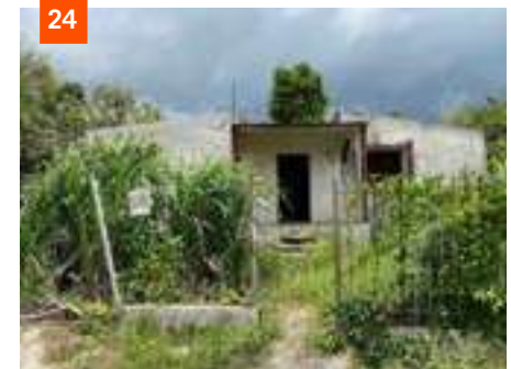
24 Hatillo Casa 3H / 1B Com. Roberto Clemente, Parcelas #507 Bo. Campo Alegre CATASTRO: 051-035-382-53-000 18.422772, -66.786505