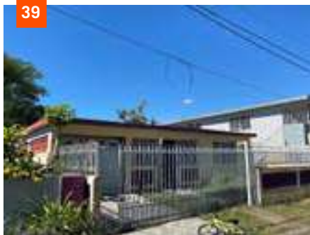
39 Juncos Com. Placita III, Parcela 64, Bo. Gurabo Abajo CATASTRO: 227-017-428-53-000 Casa 2H / 2B 351 M/C 874 P/C 18.24338381, -65.89729587