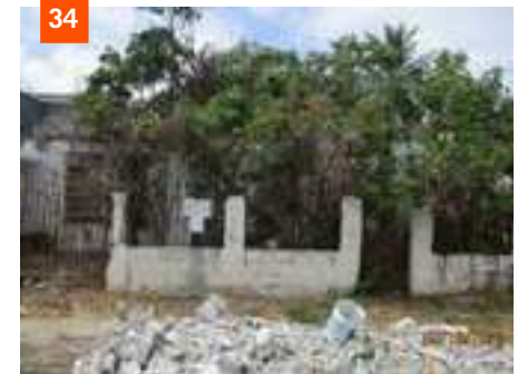
34 Fajardo Casa 3H / 1B Estancias del Mar, E-15 Calle 24 Orquidea CATASTRO: 178-039-618-15-000 714 P/C 18.299296, -65.636767