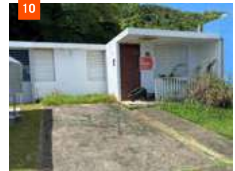
10 Barranquitas Casa 3H / 1B Urb. Vistas de Montecielo, N-4 Calle Lirios CATASTRO: 246-088-291-36-000 18.19143198, -66.32610444