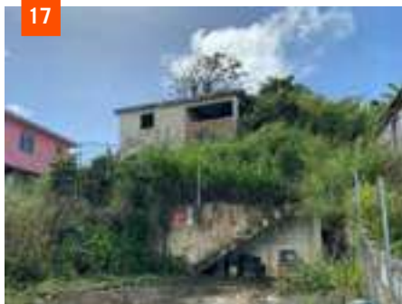
17 Comerio Casa 3H / 1B C.R. Naranjo, Parcela #247 Bo. Naranjo CATASTRO: 249-003-269-24-000 18.216468, -66.173237