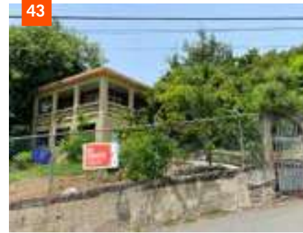
43 Guánica Bo. Las Joyas, Parc. 103 Sect. Las Latas CATASTRO: 384-080-907-72-000 Casa 3H / 1B 548 M/C 860 P/C 18.0062, -66.8757