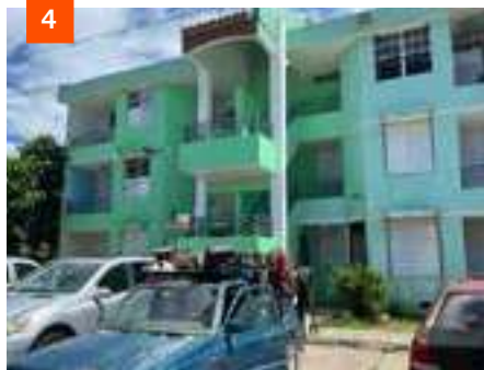
4 Caguas Apartamento 3H / 1B Cond. Bunker Park, Apart. B-10 C CATASTRO: 225-074-238-01-002 18.22585737, -66.04125147