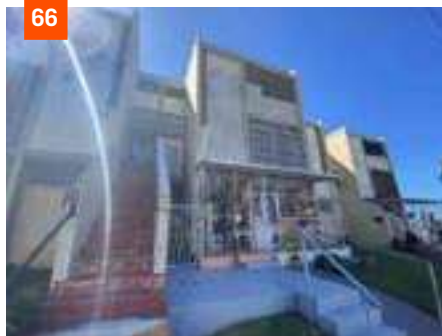
66 Mayagüez Cond. Río Cristal A- Cluster 8 Apto. P-8; B-Cluster 7 Apto. W-13-B; C- Cluster 7 Apto W-12C; D-7W-4C 2ndo Piso Varios Apartamentos 3H / 3B 1,119 P/C CATASTRO: 259-009-602-04-723 18.183208, -67.13661