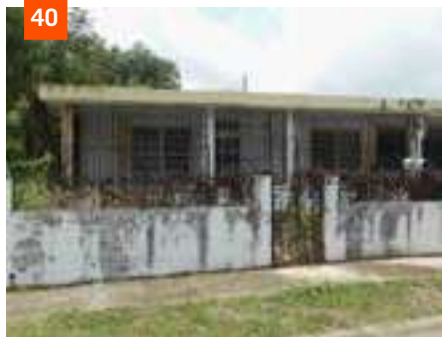
40 Fajardo Urb. Veve Calzada #0-5 Calle 5 CATASTRO: 150-005-001-05-001 Casa 3H / 1B 455 M/C 782 P/C 18.338995, -65.66064