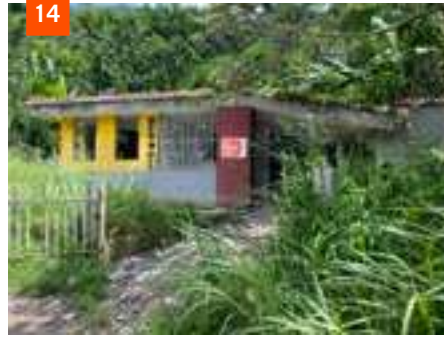
14 Corozal Casa 3H / 1B Barrio Palos Blancos, Lote 1 Km 3.5 CATASTRO: 168-082-107-28-000 18.28333, -66.3024