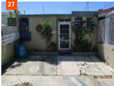
27 Carolina Casa 2H / 1B Urb. Estancias del Parque, F5 Calle 4 CATASTRO: 117-021-071-47-000 109 M/C 655 P/C 18.365636, 65.932018