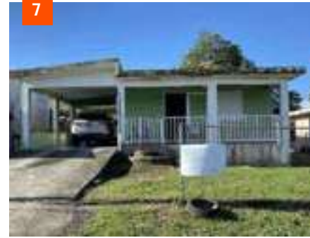
7 Humacao Casa 2H / 1B Comunidad Aniceto, Parcela 8 calle 2 Candeleiro Abajo CATASTRO: 353-010-588-04-001 18.09241, -65.81534