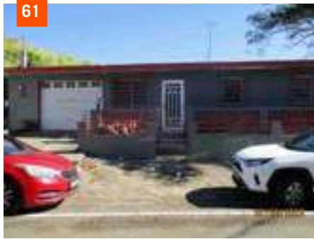
61 Coamo Bo. Pedro García, Carr 155 KM 9.5 Casa 3H / 2B 557 M/C 838 P/C CATASTRO: 295-000-010-18-001 18.128704, -66.387202