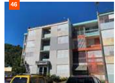
46 Caguas Cond. Villas de Castro, Apto F-1C CATASTRO: 251-009-916-25-703 Apartamento 3H / 1B 870 P/C 18.213743, -66.009988