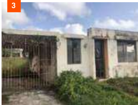
3 Fajardo Casa 3H / 1B Urb. San Pedro, M-16 calle San Pedro Bo. Florencio CATASTRO: 150-093-577-30-000 18.310775, -65.6712