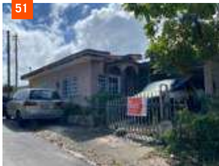
51 Utua Com. Cayuco, Parcela 404 Bo. Caguanas CATASTRO: 161-063-254-69-000 Casa 2H / 2B 395 M/C 1261 P/C 18.28848201 -66.73236988