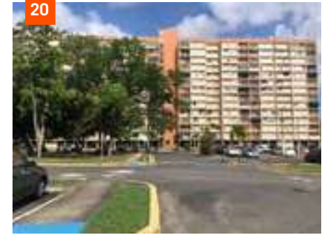
20 San Juan Apartamento 3H / 1B Cond. Torres de Cervantes, Apto 1205 Edif. A CATASTRO: 087-008-039-09-165 18.40395, -66.01362