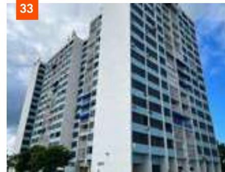
33 Toa Baja Apartamento 3H / 1B Cond. El Atlántico, Apto. 1302 CATASTRO: 039-063-101-13-122 848 P/C 18.44670237, -66.17335644