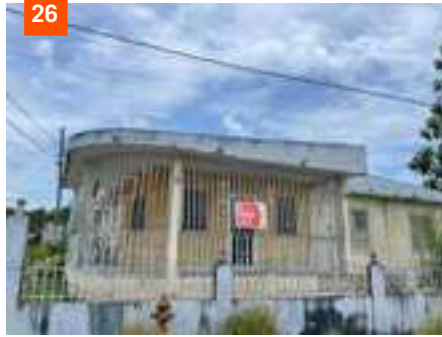
26 Vega Baja Casa 3H / 2B C.R. Guarico #519 Bo. Algarrobo CATASTRO: 035-034-406-02-001 502 M/C 1,406 P/C 18.456, -66.417