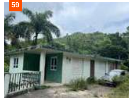
59 Coamo Bo. Coamo Arriba, Carr 555 Km 8.5 CATASTRO: 296-044-268-07-000 Income Property 3H/1B 2H / 1B 941 P/C 18.14159830 -66.35314402