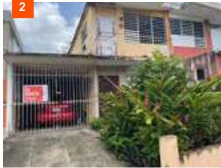
2 Bayamón Casa 3H / 1.5B Urb. El Cortijo, AF-4 Calle 21 CATASTRO: 113-043-698-39-001 18.35979830, -66.16999703