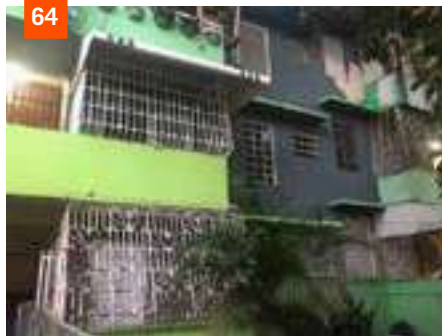
64 San Juan Coop. Villa Kennedy, Apto. 118 Edif. 9 Apartamento 2H / 1B 604 P/C CATASTRO: 041-094-410-02-118 18.43756, -66.04402