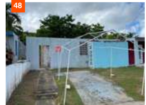
48 Fajardo Santiago Veve Calzada, Solar D-12 Bo. Quebrada Fajardo CATASTRO: 150-036-375-54-000 Casa 3H / 1B 327 M/C 608 P/C 18.329786, -65.65443