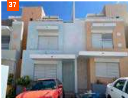
37 Ceiba Cond. Portal de Ceiba, Apto. 29 y Apto. 30, Bo. Chupacallos CATASTRO: 205-067-072-03-000 Apartamento 3H / 2.5B Apt.29; 3H/2.5B Apt. 30; 2H/1B