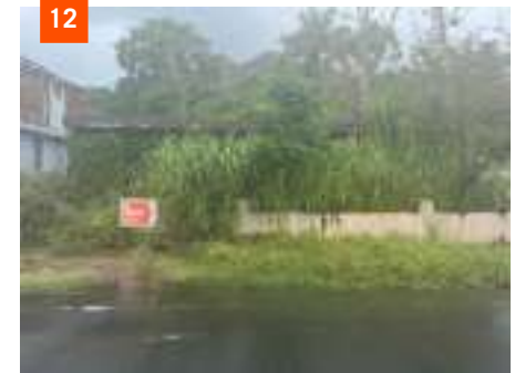
12 Ciales Casa 3H / 1B Urb. Dos Ríos, #A-56 Bo. Hato Viejo Carr. 149 CATASTRO: 108-095-051-19-001 18.3443, -66.4712