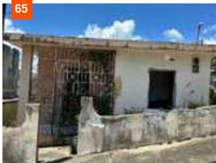
65 Cayey Com. El Polvorín, Calle 17 #LL-10, Bo. Monte Llano Casa 3H / 1B 101 M/C 521 P/C CATASTRO: 324-035-098-06-001 18.11314226, -66.1599759