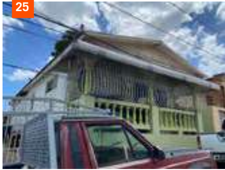
25 Coamo Casa 3H / 2B Coamo (Pueblo) Calle San Tomas #26 CATASTRO: 345-043-082-12-001 251 M/C 748 P/C 18.07628652, -66.35706152