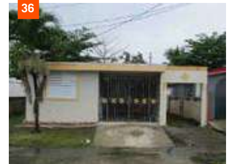
36 Naguabo Casa 3H / 1B Urb. Brisas del Valle, Lote I-13 Calle1 CATASTRO: 256-011-308-34-000 264 M/C 783 P/C 18.212494, -65.743808