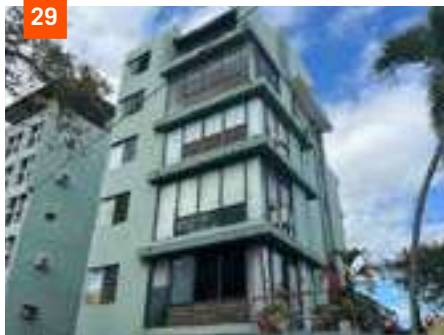
29 San Juan Apartamento 1H / 1B Cond. Caparra Park, Apto PH-A CATASTRO: 79-062-076-530-18-008 695 P/C 18.41118450, -66.09148361