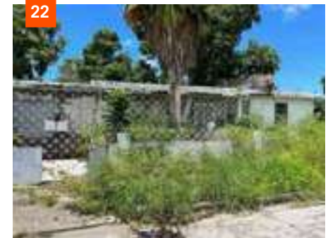
22 Ponce Casa 3H / 2B Urb. Palo de Pan, D-7 Bo. Caña CATASTRO: 388-080-960-05-001 18.00610665, -66.62483695