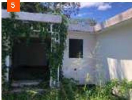
5 Canóvanas Casa 3H / 2B Alturas de Campo Rico, 420 Calle 16 CATASTRO: 146-027-514-27-000 18.332957, -65.895368