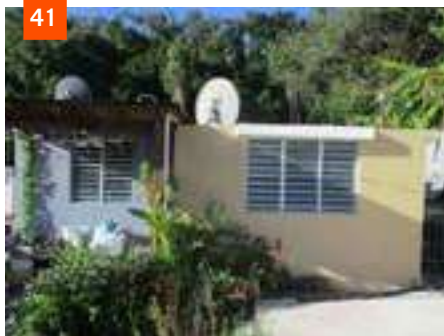
41 Ponce Urb. Villa Paraíso, #H-4 calle 2 Bo. Pastillo CATASTRO: 364-041-745-07-000 Casa 3H / 1B 276 M/C 845 P/C 18.034369, -66.667391