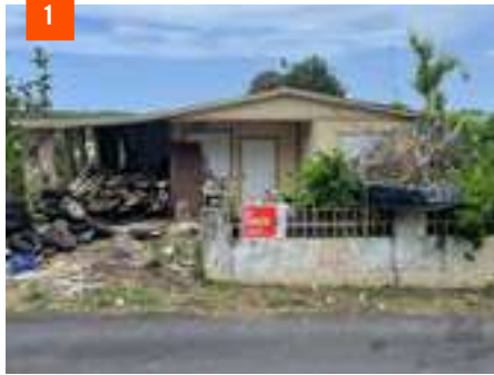
1 Vega Baja Casa 2H / 1B Brisas de Tortuguero, Parcela #457 C.R. Guarico Bo. Algarrobo CATASTRO: 035-034-413-05-000 18.455624, -66.413078