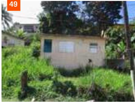
49 Cidra Bo. Bayamón, Sector Sopera Km 0.7 Carr. 787 CATASTRO: 276-000-001-31-000 Casa 2H / 1B 510 M/C 762 P/C 18.172343 -66.11867