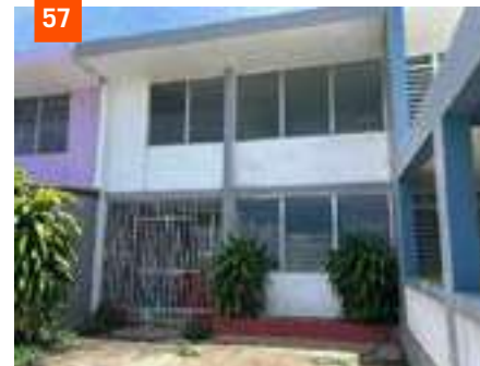
57 Vega Baja Urb. Las Flores, C-12, Bo. Cabo Caribe CATASTRO: 035-058-257-14-001 Casa 3H / 1.5B 954 P/C 18.44840757 -66.39003643