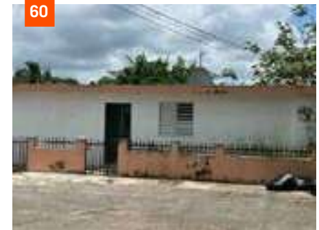
60 Villalba Com. Rural Toa Vaca, Bo. Hato Puerto, Parcela 332 CATASTRO: 319-042-019-03-000 Income Property 1H/1B 490 M/C 1,877 P/C 18.11070869 -66.48978468