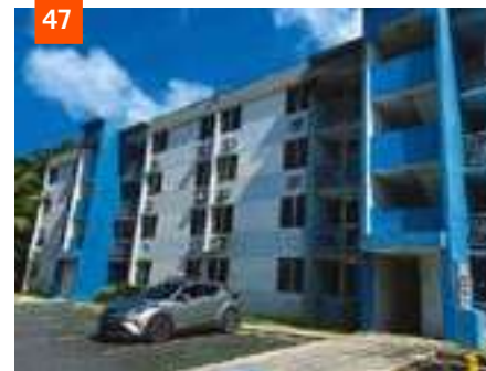
47 Vega Alta Cond. Vistas de la Vega, Apto 213 Bo. Espinosa CATASTRO: 058-057-055-32-073 Apartamento 3H / 1B 805 P/C 18.42172754, -66.33387752