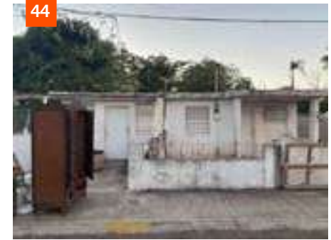
44 Guayama C.R. Puerto Jobos, Parcela #36 CalleB (1) Bo. Jobos CATASTRO: 441-042-014-000 Casa 3H / 1B 525 M/C 810 P/C 17.951812, -66.179236