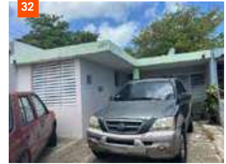
32 Luquillo Casa 3H / 1B Urb. Brisas del Mar, C-12 Calle 5 CATASTRO: 092-095-043-12-001 185 M/C 915 P/C 18.22454, -65.43237