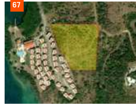
67 Culebra Culebra, Bo. Frailes, Solar 1 Finca 5 Cdas CATASTRO: 476-000-003-21-000 18.29820613, -65.27507253