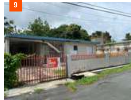
9 Gurabo Casa 3H / 1B C.R. Navarro, Parcela #220 Carr. 1 Bo. Navarro CATASTRO: 225-060-195-13-001 18.22963, -66.00468