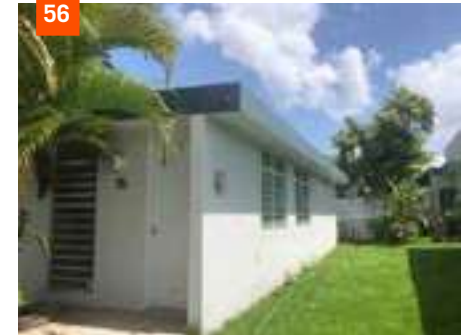
56 Trujillo Alto Cond. Cima de Villa, Apto. 18 Bo. Carraizo CATASTRO: 144-036-261-09-018 Apartamento 3H / 2B 906 P/C 18.330624 -66.03057