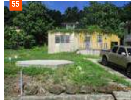
55 Fajardo C.R. San Pedro, Solar 138 Calle 7 Bo. Florencio CATASTRO: 150-091-533-36-000 Casa 3H / 1B 434 M/C 900 P/C 18.312181 -65.381557