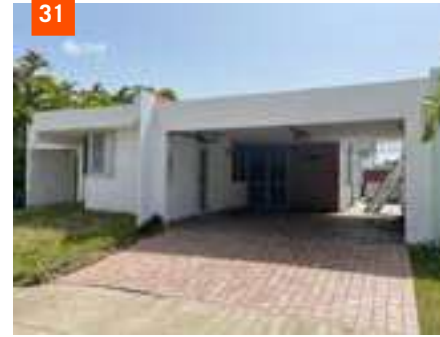
31 Cataño Casa 3H / 2B Urb. La Mansión, SD-2 Plaza 10, Secc. Mansión del Sur CATASTRO: 039-094-262-09-001 310 M/C 1461 P/C 18.43550010, -66.16312401