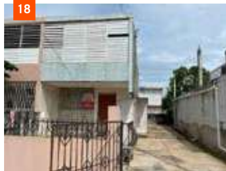
18 Mayagüez Casa 3H / 1.5B Villa del Oeste, 5-D Calle Sagitario CATASTRO: 259-025-527-33-001 18.17847414, -67.15728861