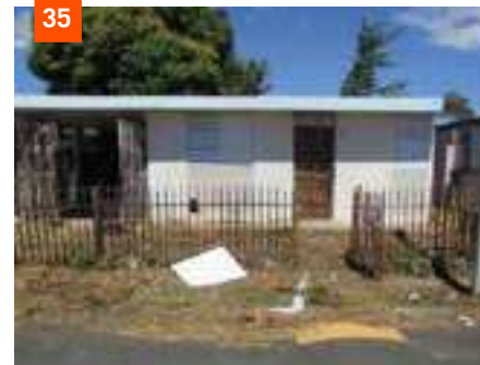
35 Salinas Casa 3H / 1B Urb. Las Antillas, E-29 calle Puerto Rico, Bo. Pueblo CATASTRO: 417-054-137-29-001 294 M/C 785 P/C 17.9794, -66.2916