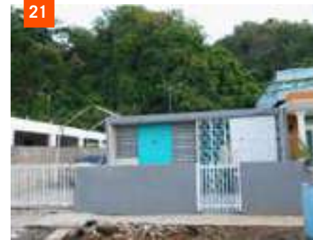
21 Manatí Casa 2H / 1B Urb. Las Gardenias, A5 calle Dalia CATASTRO: 056-025-525-2-001 18.42626580, -66.47364858