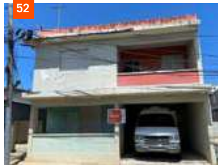
52 Arecibo Pueblo, 216 Calle Cristóbal Colón CATASTRO: 012-085-162-34-000 Casa 3H / 1B 85 M/C 1220 P/C 18.47049928 -66.71859310